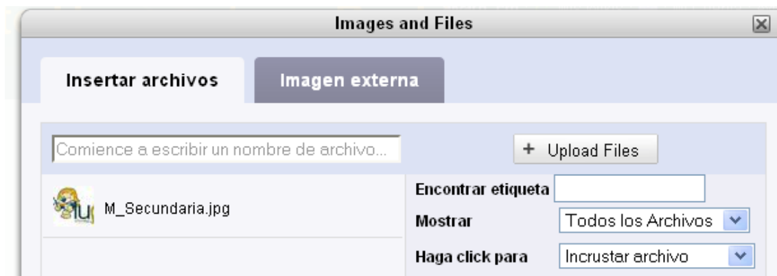
Ilustración 3: Interfaz para seleccionar o subir imágenes al servidor.

Para cargar una imagen en el servidor sólo hay que presionar el botón “Upload Files”. La imagen cargada aparecerá en la parte izquierda del cuadro de diálogo.