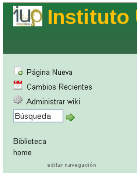
Ilustración 1: opciones básicas de administración del wiki.